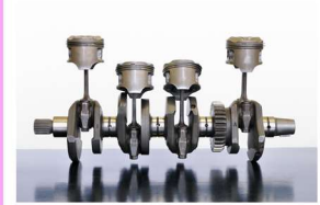
ピストン・コンロッド クランクシャフト