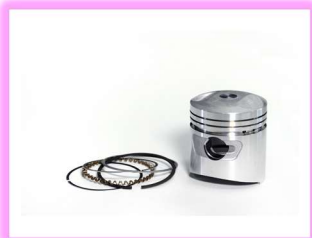
ピストン・ピストンリング